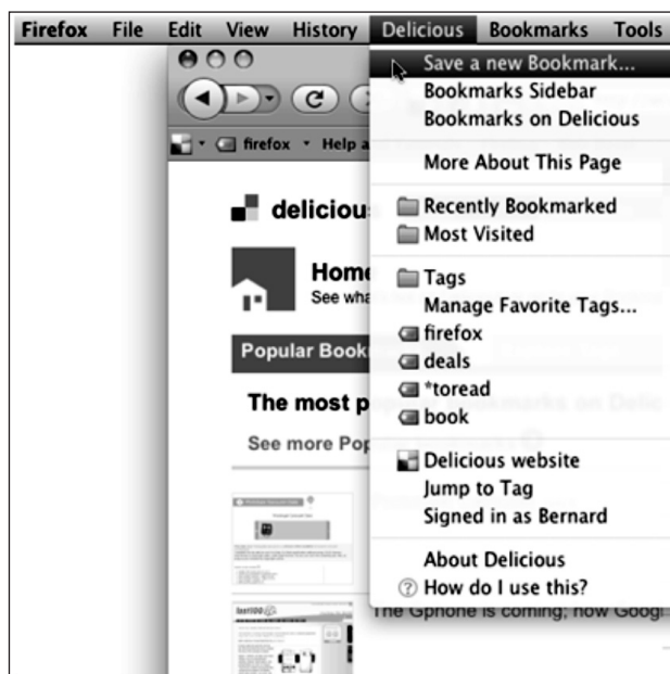
Рис. 5. Пример средства для создания тегов [13]

содержания тегами позволяет обеспечить быстрый доступ и способность группировки связанных терминов (рис. 5.);