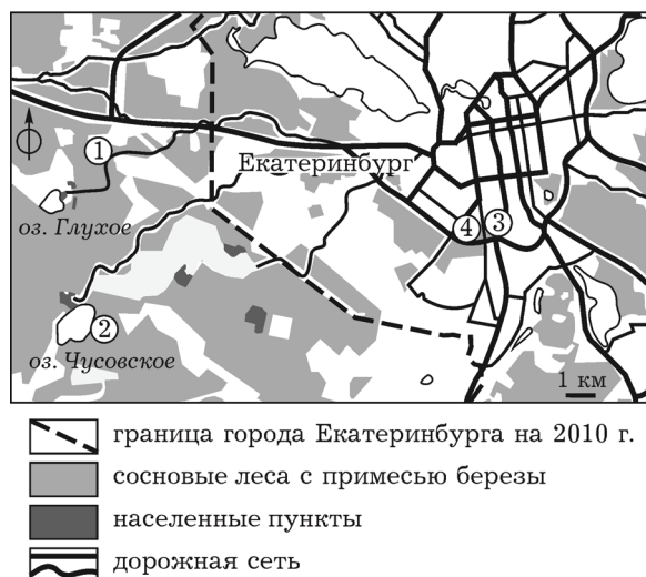
Рис. 1. Расположение экспериментальных участков с разным сочетанием рекреации и урбанизации: 1 – окрестности оз. Глухое (У–Р–), 2 – окрестности оз. Чусовское (У–Р+), 3 – дендрарий (У+Р–), 4 – “Юго-Западный” лесопарк (У+Р+)

лесов однородны и представлены спелыми высокополнотными древостоями 120–140-летнего возраста II–III классов бонитета [Шавнин и др., 2011]. На территории города и за его пределами выбрано по два участка леса с различным сочетанием антропогенных факторов: рекреации (Р) – интенсивность посещения людьми, и урбанизации (У) – комплекс остальных трудноразделимых факторов, характерных для городской среды, в том числе аэротехногенное загрязнение от автотранспорта и предприятий (рис. 1). Выделяли две градации действующего фактора: высокий уровень (обозначено знаком “+”) и низкий уровень (“–”). Краткое описание участков: 1) окрестности оз. Глухое (У–Р–) – мало посещаемый лесной массив в 4 км от границы города (на 2010 г.), находящийся вдали от крупных автострад; 2) окрестности оз. Чусовское (У–Р+) – часто посещаемый населенным лесной массив по соседству с садово-дачными участками на расстоянии 9 км от границы г. Екатеринбурга; 3) дендрарий (У+Р–) – огороженный участок леса в черте г. Екатеринбурга на территории Ботанического сада УрО РАН с запретом посещения в последние 50 лет, находится вблизи крупных автомагистралей и промышленного района; 4) лесопарк “Юго-Западный” (У+Р+) – лесной массив в черте города, место отдыха горожан,