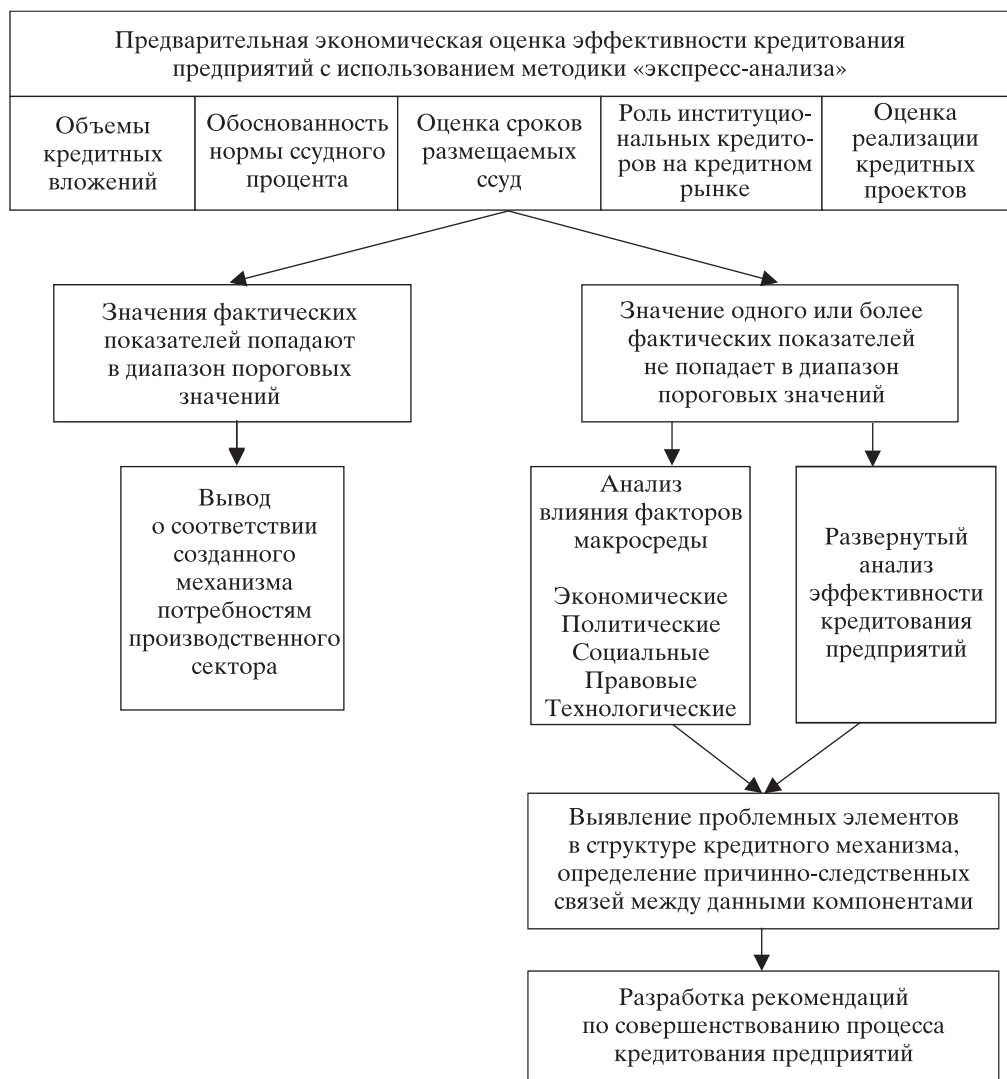
Рис. 1. Схема проведения оценки эффективности кредитования предприятий

Если хотя бы один показатель не попадает в диапазон пороговых значений, значит отмечается нецелесообразность структуры и процессов механизма финансирования предприятий.