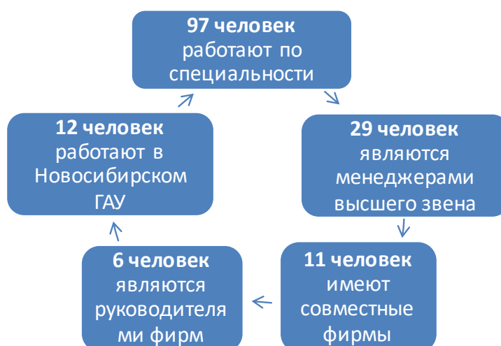
Рис. 2. Трудоустройство практикантов

Глобализация требует от будущих руководящих работников пребывания за границей в течение нескольких месяцев. Многие практиканты успешно работают по специальности, в международных организациях и имеют собственные фирмы (рис. 2).