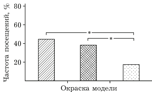
Рис. 2. Цветовые предпочтения самцов P. napi ( N = 47 ). Обозначения как на рис. 1