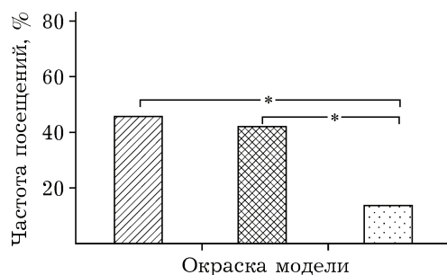
Рис. 3. Цветовые предпочтения самок P. napi ( N = 31 ). Обозначения как на рис. 1

посещения имаго P. napi синих и красных моделей статистически не различается ( \chi^2 = 0,242 , P = 0,622 ).