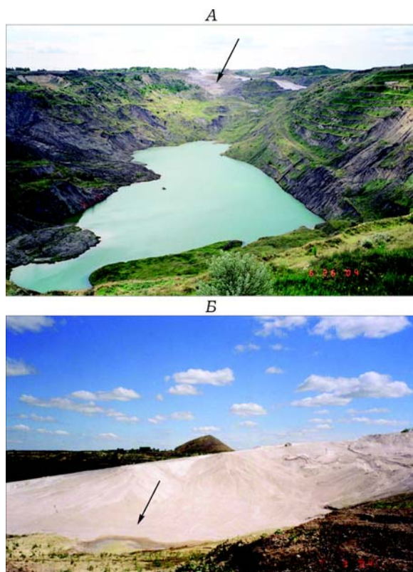
Рис. 2. Панорама карьера разреза “Батуринский” – места складирования самораспадающихся феррохромовых шлаков ЧЭМК. Окрестности пос. Красногорский, Челябинская обл., июль 2004 г.

А – техногенное озеро в карьере, смежном с местом складирования шлаков; стрелка указывает на линию наземной транспортировки феррохромовых шлаков; Б – шлаковое поле в карьере; стрелка указывает на зону истечения грунтовых вод