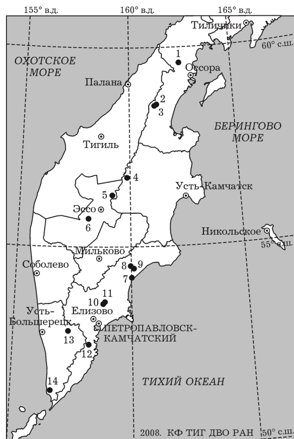
Рис. 1. Термальные источники, по которым имеются данные о флоре печеночников: 1 – Тымлатские, 2 – Хухлотва-ямские, 3 – Русаковские, 4 – Верхнекиреунские, 5 – Оксинские, 6 – Окура, 7 – Нижнесемячские, 8 – кальдеры Узон, 9 – долины Гейзеров, 10 – Краеведческие, 11 – Таловские, 12 – Мутновские, 13 – Апачинские, 14 – Кошелевские

В статье обобщены сведения о произрастании печеночников вблизи 14 групп термальных источников: 3 группы расположены в Северной Камчатке (Тымлатские, Хухлотва-ямские, Русаковские), 3 – в Центральной (Окура, Оксинские и Киреунские), 5 – в Восточной (Нижнесемячские, долины Гейзеров, кальдеры Узон, Краеведческие, Таловские), 3 – в Южной Камчатке (Мутновские, Апачинские, Кошелевские). Географическое положение источников показано на рис. 1.