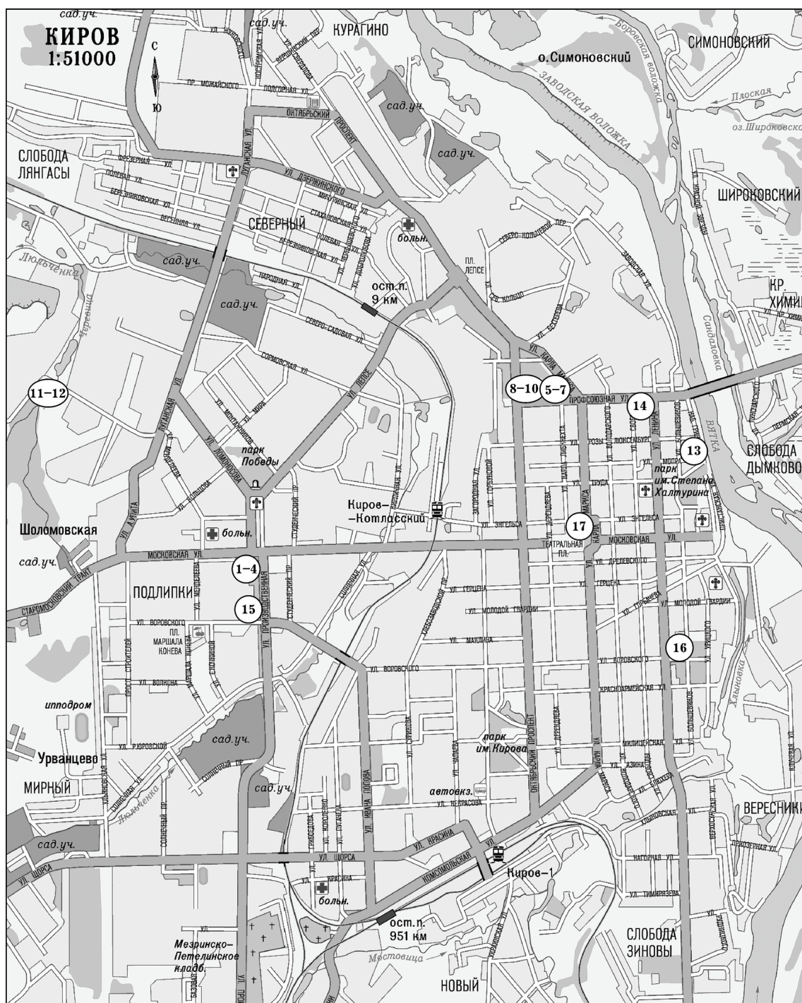
Рис. 1. Точки отбора почвенных образцов на территории г. Кирова.

1-4 – перекресток улиц Московской и Производственной на расстоянии 1, 5, 15, 30 м от полотна дороги соответственно; 5-7 – перекресток улиц Профсоюзной и Карла Маркса на расстоянии 0-10, 10-20, 30-40 м от дороги соответственно; 8-10 – перекресток ул. Профсоюзной и Октябрьского проспекта на расстоянии 0-10, 10-20, 30-40 м от дороги соответственно; 11, 12 – район Биохимического завода; 13 – Александровский сад; 14 – перекресток улиц Ленина и Профсоюзной; 15 – перекресток улиц Воровского и Производственной; 16 – парк им. Гагарина; 17 – перекресток улиц Энгельса и К. Маркса