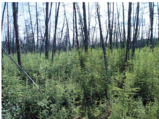
Рис. 4. Возобновление лиственницы Гмелина на гарях.

Выявлено, что природная пожарная опасность северо-таежных лиственничников высокая (Абаимов и др., 1990; Цветков, 1996). Она обусловлена многими факторами, прежде всего природными особенностями территории. Здесь господствует континентальный климат с длительными, засушливыми периодами. В сочетании с доминированием наиболее пожароопасных светлохвойных лесов (более 80 % покрытых лесом земель) это привело к тому,