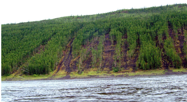
Рис. 2. Солифлюкция.

Он прожил долгую, трудную и плодотворную жизнь. Им многое сделано в области фундаментальных и прикладных вопросов лесной пирологии, таксации, лесоведения. Он автор более 150 научных трудов, в том числе пяти монографий.