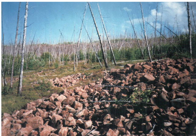
Рис. 1. Курумник.