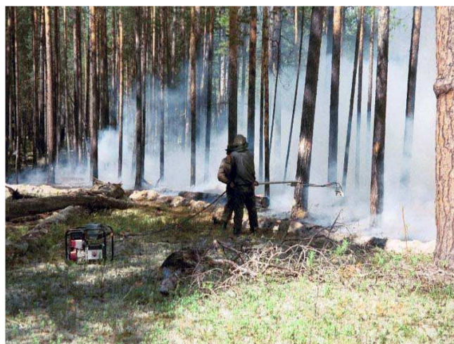
Рис. 5. Взятие образцов эмиссий при пожаре в сосновом насаждении (фото С. Конард).

В Сибири сосняки составляют до 30 % от площади хвойных лесов. В результате исследований получены новые данные о периодичности лесных пожаров, дана оценка природной пожарной опасности сосновых лесов и определены особенности формирования комплексов лесных горючих материалов в различных лесорастительных зонах. Раскрыт механизм влияния живого напочвенного покрова