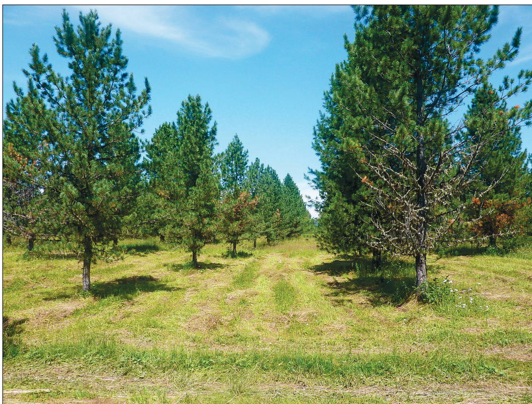
Рис. 3. Повреждение хвои через два года (2013 г.).