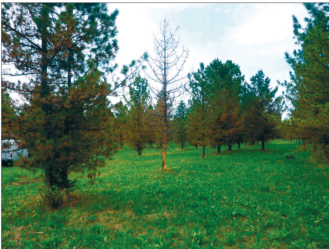
Рис. 4. Повреждение хвои на четвертый год (2015 г.).