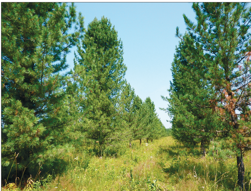
Рис. 2. Начальная стадия повреждения хвои (2011 г.).

Проведенный нами анализ показал, что патоген, вызывающий поражение хвои на плантациях кедра, относится к роду Mycosphaerella Johanson. В базе данных NCBI он однозначно идентифицирован как Mycosphaerella pini Rostr.,