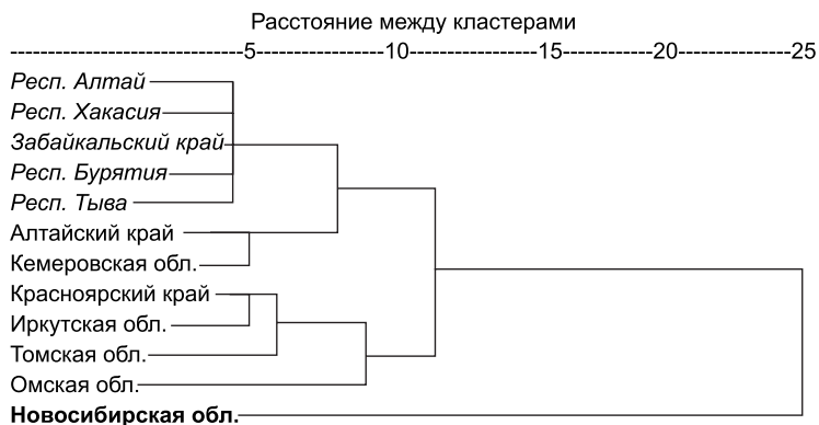
Рис. 2. Результаты кластерного анализа регионов Сибири, 2010 г.

Проанализировав результаты иерархического кластерного анализа, отраженные на рис. 1 и 2, мы исключили из анализа фактор, опре-