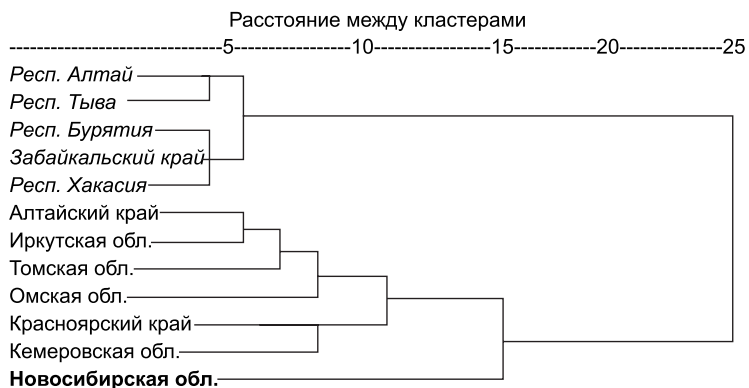
Рис. 1. Результаты кластерного анализа регионов Сибири, 2007 г.

Результаты иерархического кластерного анализа по окончании работы представляются на дендрограммах. Дендрограмма отражает процесс агломерации, слияния отдельных переменных в единый окончательный кластер. По оси X откладывается межкластерное расстояние, а по оси Y – номера или обозначения объектов. Результаты кластерного анализа регионов Сибири для 2007 г. представлены на рис. 1. Из этой дендрограммы видно, что вначале, на расстоянии меньше 5, объединяются