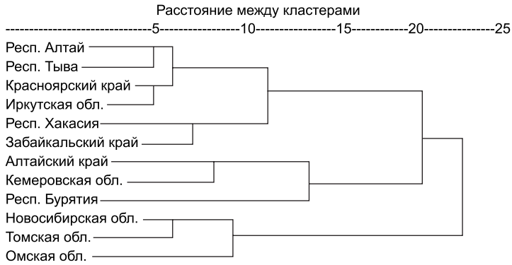
Рис. 4. Результаты кластерного анализа регионов Сибири с учетом их размеров, 2010 г.

лена Кемеровская область (жирный шрифт) как регион, выпускающий наибольший объем инновационной продукции на 1000 руб. ВРП и использующий наибольшее количество передовых технологий на 1000 исследователей. Томская и Новосибирская области также представляют собой отдельный кластер как области со схожими профилями инновационного развития (курсив). Как и прежде, даже с учетом размера, в отдельный, третий, кластер были выделены малые регионы (жирный курсив). Остальные регионы образовали четвертый кластер.