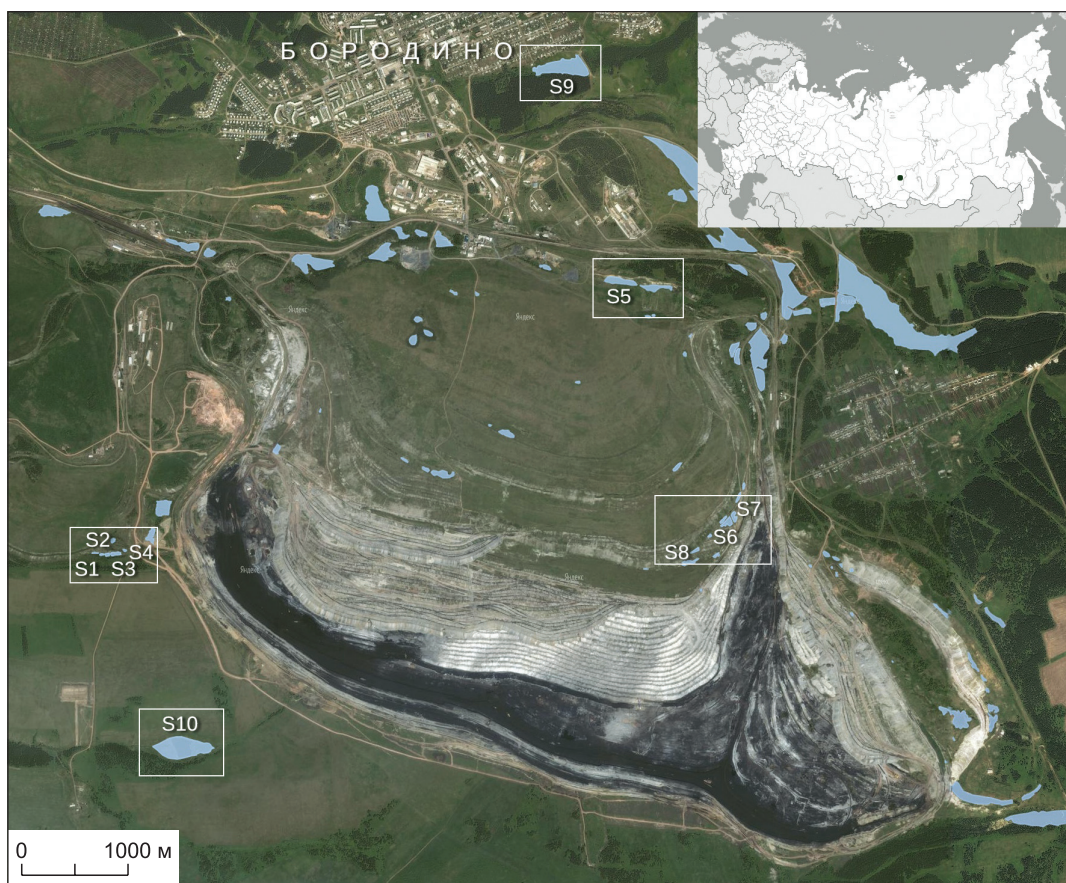
Рис. 1. Схема Бородинского угольного разреза и локализации тестовых (S1–S8) и контрольных (S9, S10) полигонов.

14.4 га, что составляет половину от суммарной площади всех аквальных комплексов, связанных с отвалами БУР. Аквальные комплексы изучали на 10 полигонах (участках): восьми тестовых, расположенных в пределах отвалов БУР, и двух контрольных за пределами территории угольного разреза (рис. 1).