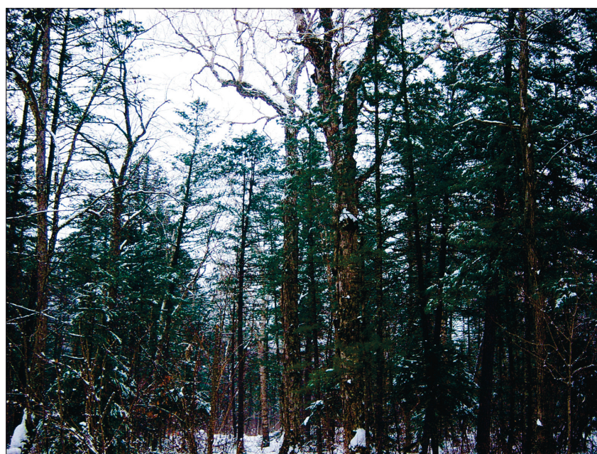
Рис. 2. Хвойно-широколиственное насаждение с елью аянской и березой желтой через 22 года после вырубki кедрa корейского (Хорское лесничество Хабаровского края).