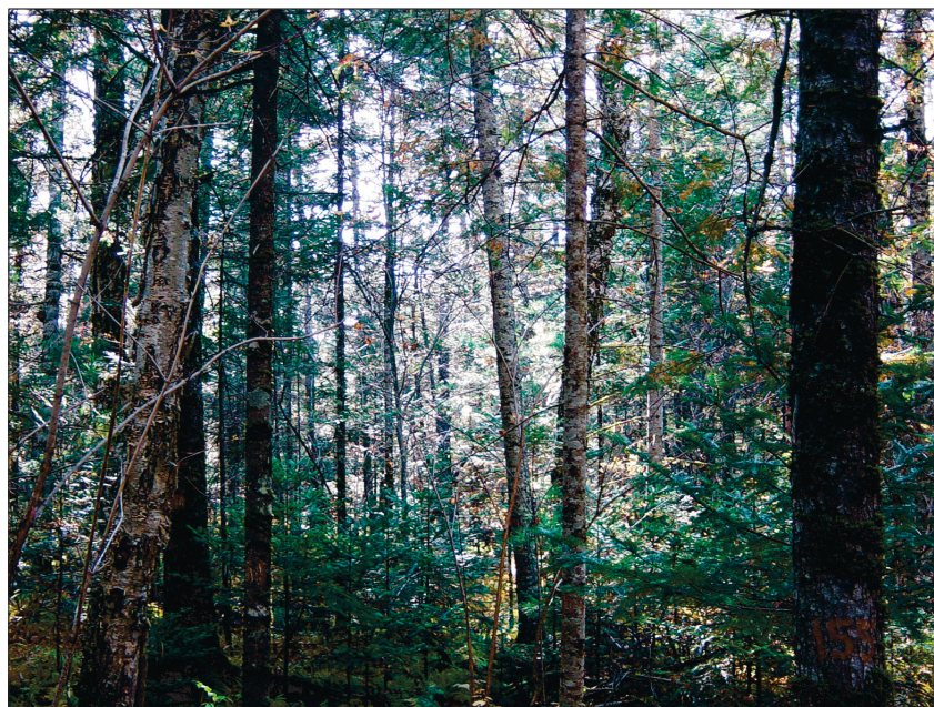
Рис. 1. Елово-широколиственный древостой, сформировавшийся после условно-сплошной рубки в кедровниках через 28 лет (Хехцирское лесничество Хабаровского края).

U. pinnato-ramosa Dieck, приземистым U. pumila L. и ясенем маньчжурским Fraxinus mandshurica Rupr., а также рябинолистные типы) некогда более интенсивно в сравнении с другими были подвержены эксплуатации вследствие лучшей транспортной доступности, но к настоящему времени утратили свои позиции (Соловьев, 1958; Корякин, 2007) (рис. 1–3).