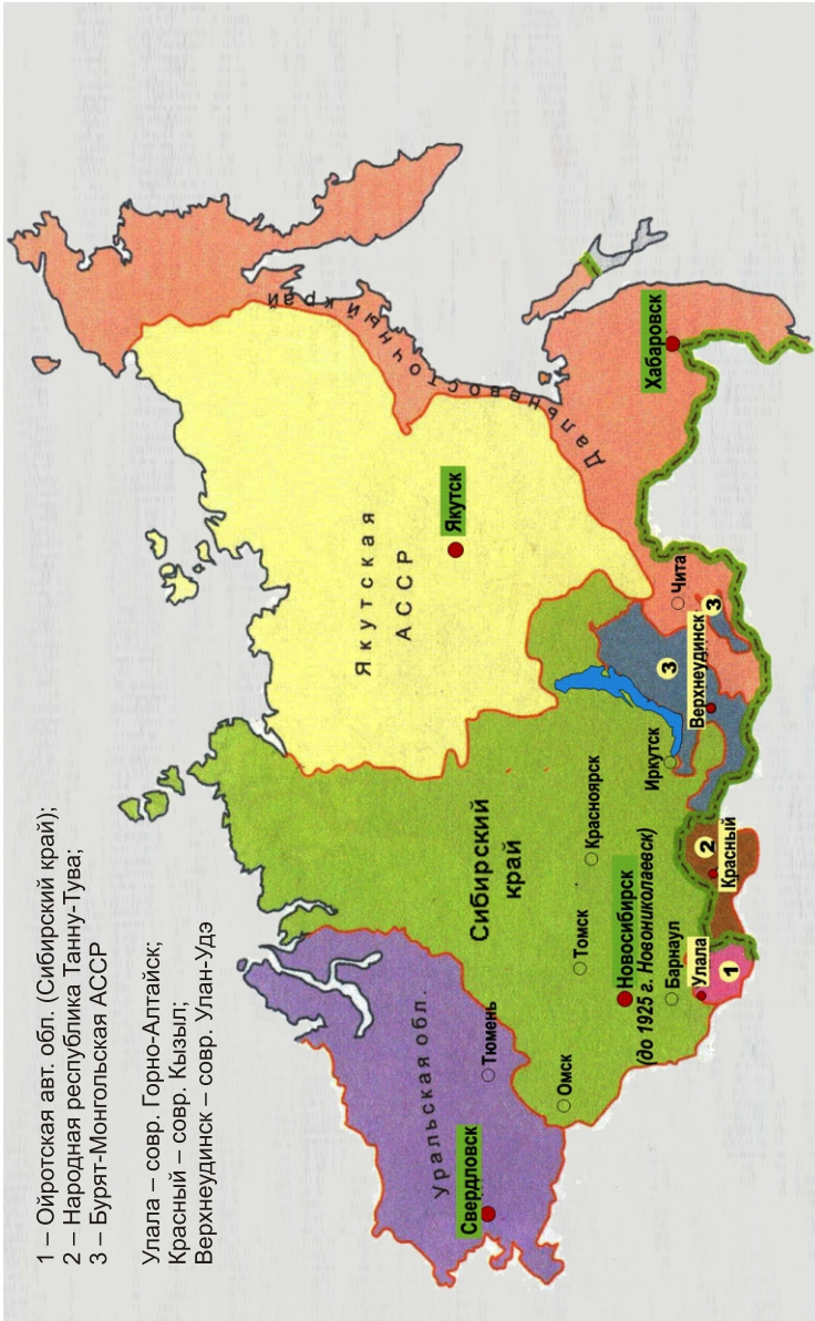
Рис. 1. Административно-территориальное устройство восточных районов СССР и фрагменты хозяйственного комплекса Сибири. 1927 г.