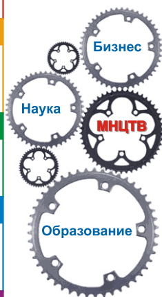
Рис. 1. Принципы создания и функционирования Международного научного центра по проблемам трансграничных взаимодействий в Северной и Северо-Восточной Азии