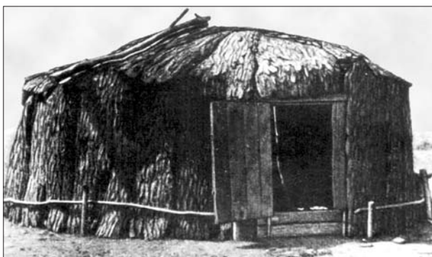
Рис. 2. Хахнас иб у сагайцев. (По: Патачаков К.М. Быт и культура хакасов в иллюстрациях (XIX – начало XX в.). Абакан, 1994. // ХакНИИЯЛИ. Рук. фонд. Д. 924).

янное, несезонное, непромысловое, используемое для жительства и зимой и летом. – Е.П.), встречается очень редко. Кроме того, она отмечала, что «одаг, служащий жилым помещением» (т. е. используемый в качестве постоянного жилья), чаще называется ат иб 2 . Еще через полвека В.Я. Бутанаев определил ат иб как стационарное жилище летнего типа подтаежной части Хакасии [6, с. 57].