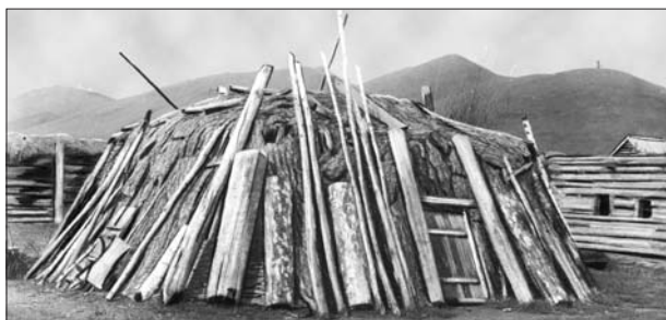
Рис. 3. Ат иб , или хахпас иб . Сагайцы. Улус Базинский. Фото С.Д. Майнагашева, 1914 г. (По: Патачаков К.М. Быт и культура хакасов в иллюстрациях (XIX – начало XX в.). Абакан, 1994. // ХАКНИИЯЛИ . Рук. фонд. Д. 924).

ни и культуре ранних кочевников, характерными чертами которой являлись освоение верховой езды (конь) и широкое использование колесницы.