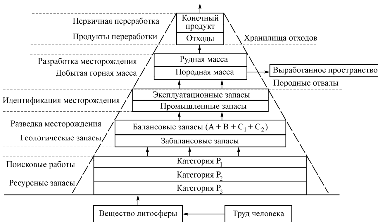
Рис. 3. Схема движения вещества литосферы в процессе освоения недр

На первом уровне, в результате проведения поисковых работ, в объеме литосферы определяют положение участков с аномальными (по отношению к кларковым) содержаниями тех или иных полезных компонентов [10]. На стадии общих поисков производится выделение, оконтуривание и геолого-экономическая оценка прогнозных ресурсов по категории P_3 . В результате дальнейшего поискового освоения перспективных территорий определяются прогнозные ресурсы категории P_2 . При этом их количество, в результате уточнения первичной информации, несколько уменьшается по отношению к категории P_3 . При дальнейшем развитии этих работ определяются ресурсы категории P_1 (рис. 3).